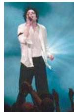
EN 1995, Jackson se presenta en los Premios MTV en Nueva York.