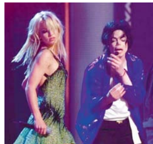
DURANTE SU CONCIERTO en el Madison Square Garden en 2001, Michael Jackson se presenta con Britney Spears.