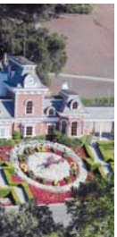
EL FUNERAL DEL REY DEL POP