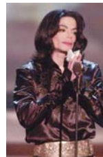
DURANTE los premios Radio Music Awards en las Vegas, en 2003, Michael agradece al público.