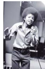
MICHAEL a los 13 años, en 1972 cuando era el miembro más joven del grupo musical The Jackson Five.