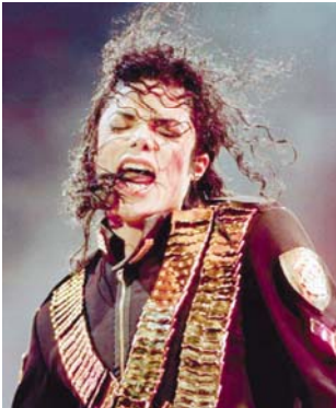
EL ASTRO del pop en su gira Dangerous, en 1993.