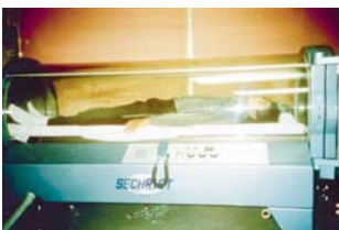
EN SEPTIEMBRE de 1986, Jackson duerme dentro de un cuarto de oxígeno.