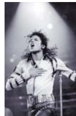
JACKSON se presenta durante su gira de conciertos en Londres, en julio de 1988.